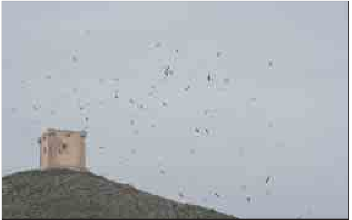
Una bandada de buitres sobrevoló Cocentaina en Tots Sants.

ÁLVAR SEGUÍ ES MIEMBRO DE FAPAS-ALCOI Y EXPERTO EN EL MEDIO NATURAL