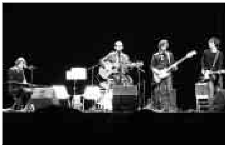
Un momento del concierto celebrado en el Principal. XAVI TEROL

Esta primera exposición se organiza también con la intención de ofrecer arte para regalo a unos precios al alcance de todos. Esta primera campaña estará abierta hasta el próximo día 5 de enero, el día de Reyes, y la oferta va desde la pintura a la escultura pasando por el grabado, plumillas o fotografías.