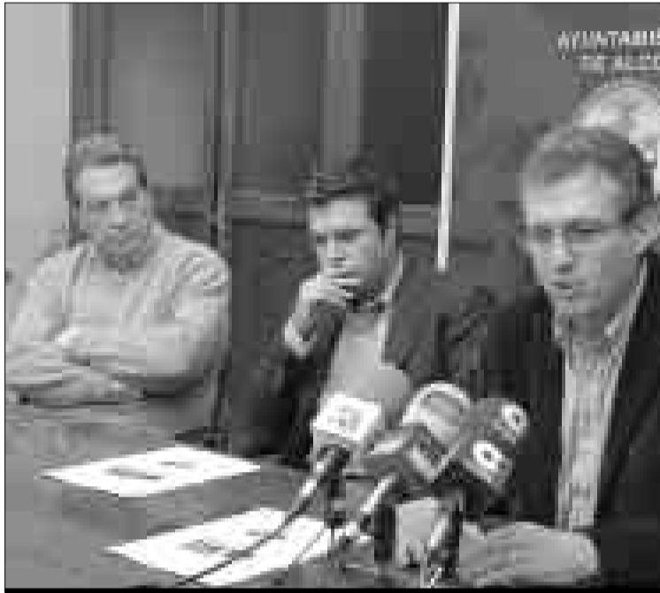
Un momento de la rueda de prensa.