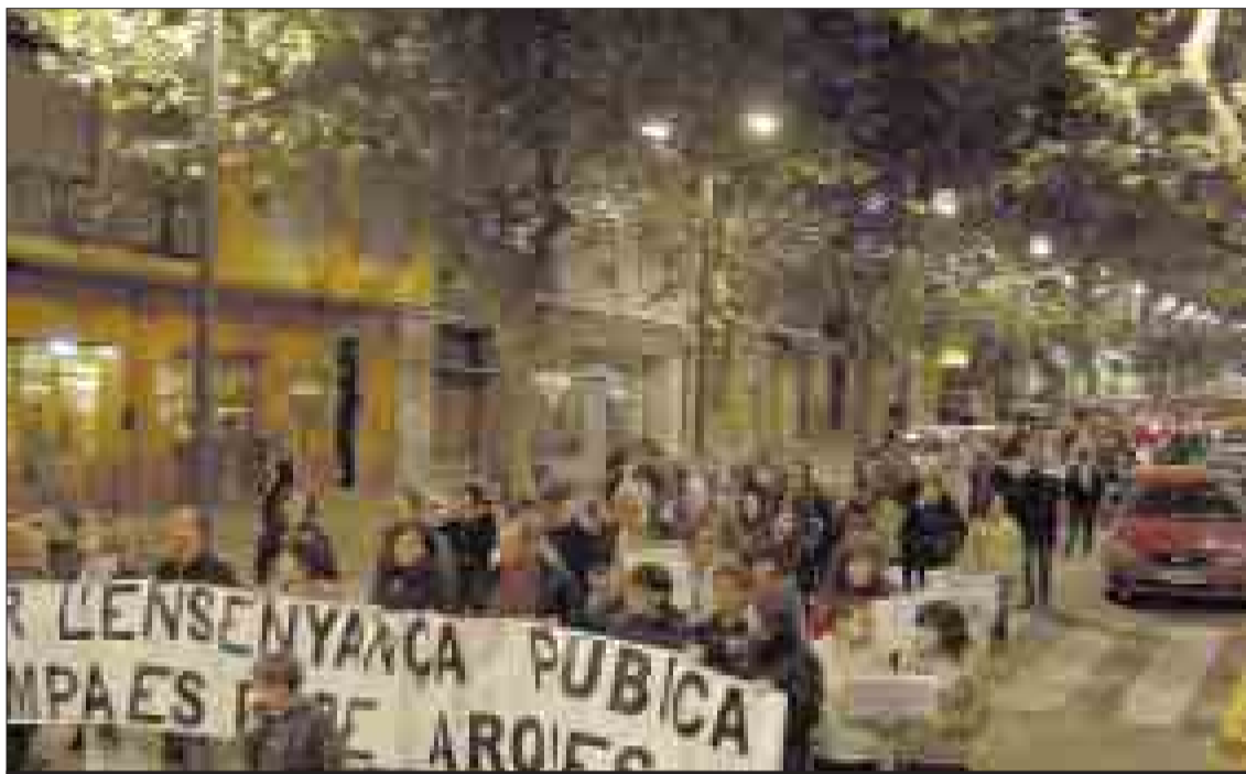
La manifestación, durante su recorrido por las calles de Cocentaina.

Las asociaciones de padres y madres del Instituto Pare Arques y los colegios públicos San Juan Bosco y Real Blanc leyeron un manifiesto en que explicaban "la gran preocupación que tenemos por la educación de nuestros hijos, debido a la nefasta y partidista política educativa del gobierno valenciano", al tiempo que pedían la dimisión del conseller Alejandro Font de Mora y que se acabe "esta broma que tan negati-