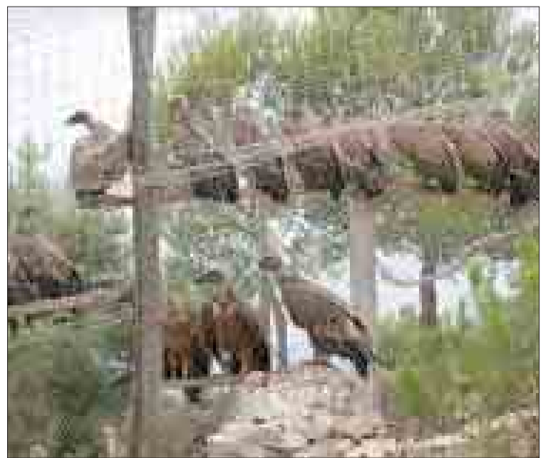
Buitres, en proceso de aclimatación.