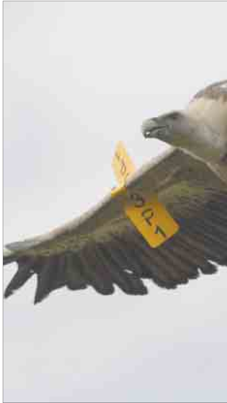
Un buitre en pleno vuelo.

Un buitre colisionó contra un avión a 11.277 m.