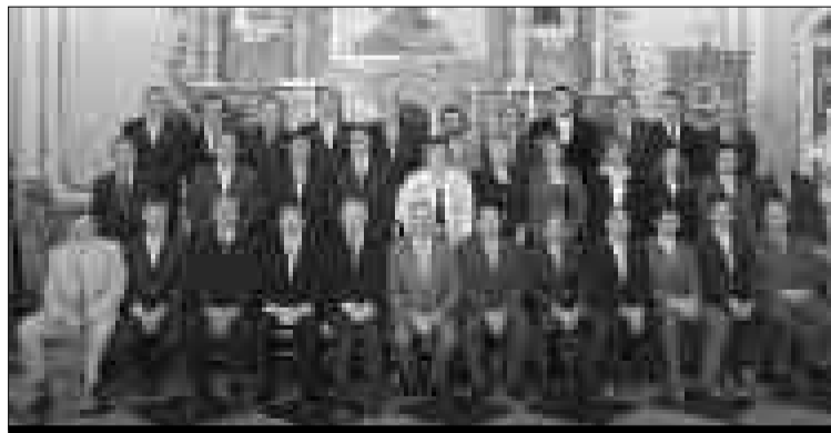
Miembros de la actual junta de la Confraría de Sant Jordi.