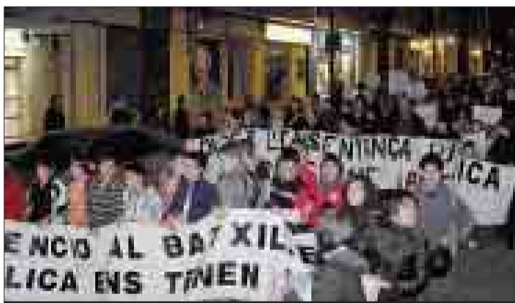
Alumnos llevando una de las pancartas.