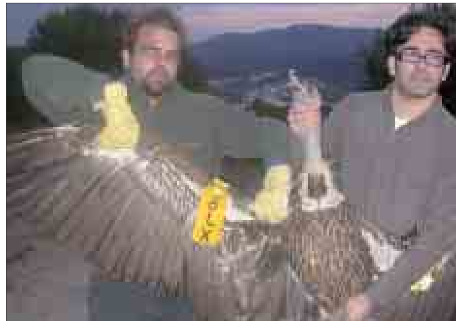
Unos voluntarios sujetan un buitre originario de África.